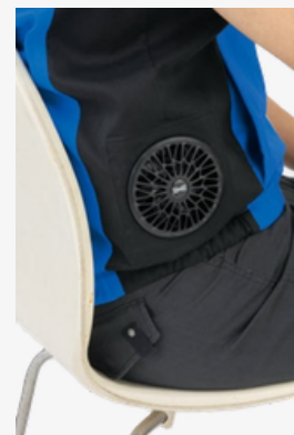
ファン取付部を脇に付ける事によって座っていてもファンが当たりにくい。