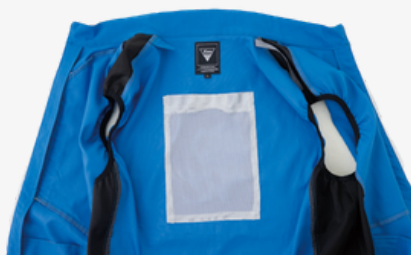
内側に保冷ポケットあり。