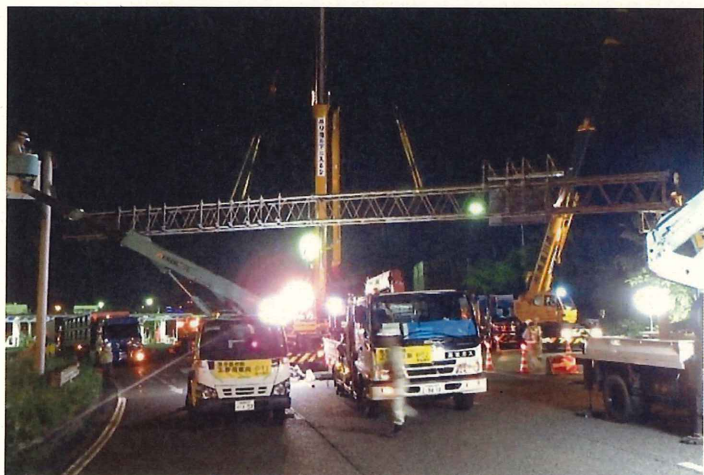
標識柱の撤去イメージ

高速道路管理車両（黄色のパトロールカー等）がお客さまの前方で速度を調整し、前方のお客さまとの間に車両がない状態を数分間つくり、その間に工事（標識柱の撤去）を実施する規制です。