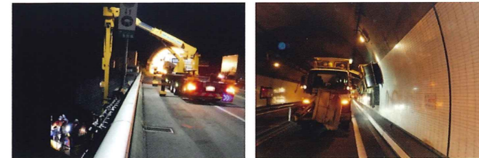
橋梁点検車を用いた橋梁下面および橋桁の点検 トンネルの側壁清掃