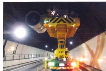
トンネルジェットファン点検