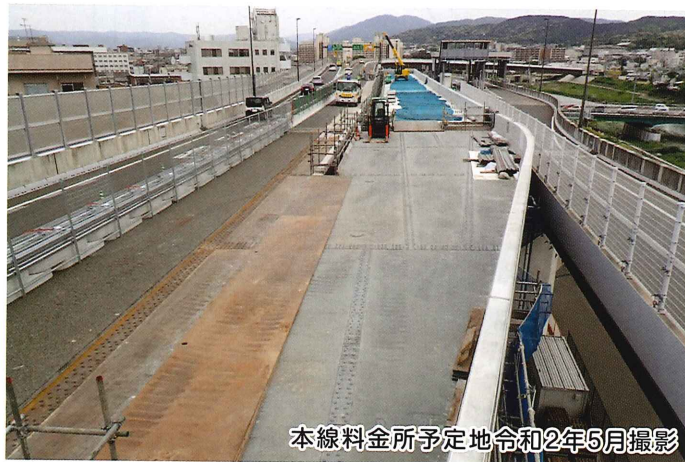
本線料金所予定地令和2年5月撮影

本線料金所の新設に伴い、 終日通行止め を行っております。 高速道路や一般国道等をご利用のお客さまや沿道の皆さまにはご不便・ご迷惑をお掛けいたしますが、工事へのご理解・ご協力をお願い致します。