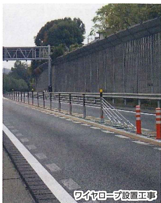
ワイヤロープ設置工事

※通行止めの時間帯は、区間内のSA・PAがご利用できません のでご注意ください。