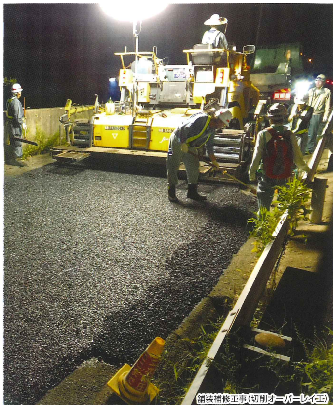
舗装補修工事(切削オーバレイ工)

お客さまに道路を安全で快適にご利用いただけるよう、 E9 京都縦貫自動車道 八木中IC(下り線入口)と千代川IC(下り線出口)で夜間閉鎖を実施し、舗装補修工事及び伸縮装置取替工事を行います。