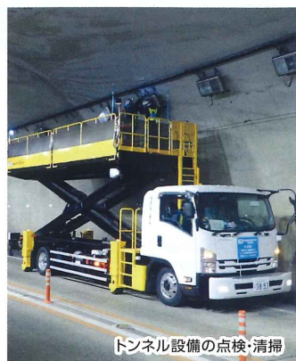
トンネル設備の点検・清掃