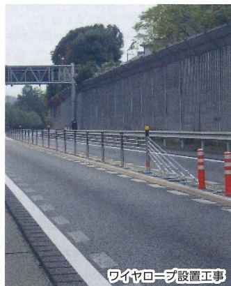
ワイヤロープ設置工事