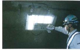
トンネル照明の点検