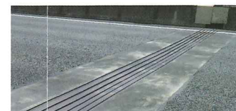
伸縮装置(橋の継ぎ目)

E1A 伊勢湾岸道は、非常に交通量が多いため、金属疲労による伸縮装置の亀裂や破断などの損傷が目立っています。平坦性の確保と道路の安全性を強化するために、早急に取り替える必要があります。