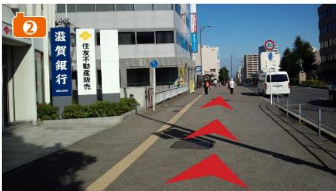
まっすぐ50メートル程で無料シャトルバスのりばです。