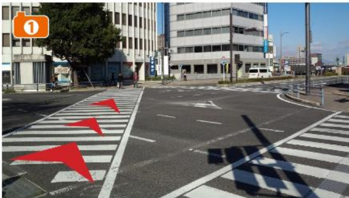
駅前のスクランブル交差点を左斜めに渡る。

JR大津駅北口の改札から道路を挟んだ向かい側左手・日本生命ビルより約50mびわ湖側(北側)に「無料シャトルバスのりば」の青い看板を設置しております。