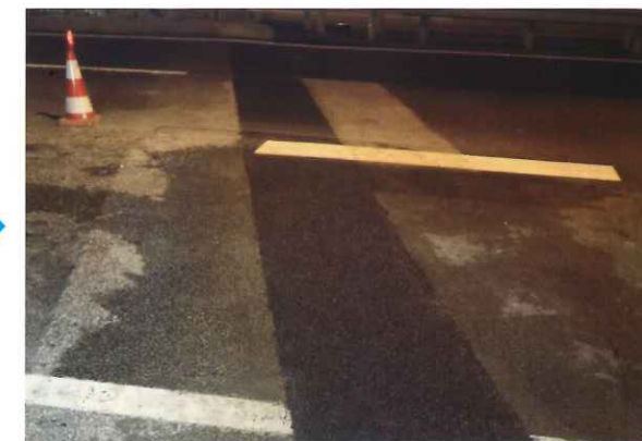
取り替え後イメージ