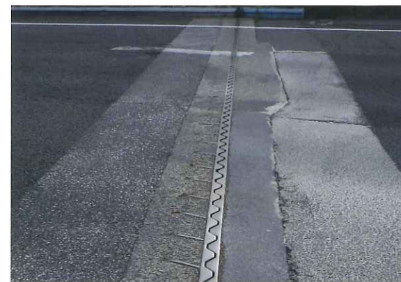
伸縮装置老朽化状況

①伸縮装置改良工事 橋の耐震補強や走行性向上のため伸縮装置と橋を一体化する工事をおこないます。