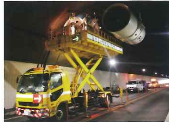
トンネル換気設備の点検

お客さまに安全で、安心・快適に 高速道路をご利用いただけるよう、 トンネル内設備や土木構造物の点検、補修、 清掃などをおこないます。