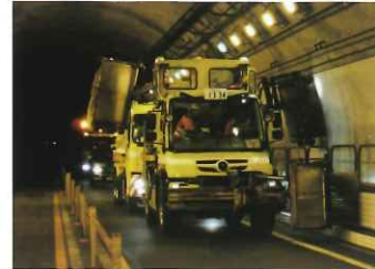
トンネル内装板の清掃