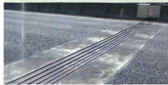
伸縮装置(橋の継ぎ目)