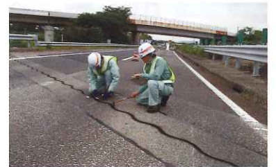
橋梁伸縮装置の点検