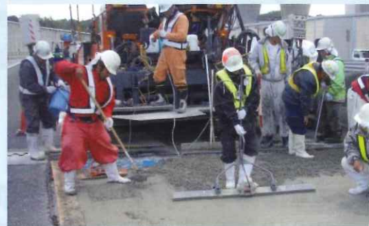
舗装下のコンクリートの修復状況