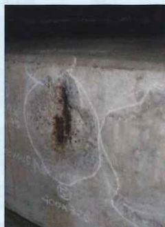
舗装下のコンクリートの劣化状況