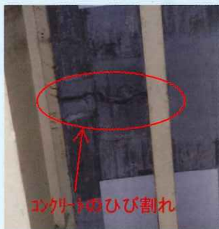
コンクリートのひび割れ